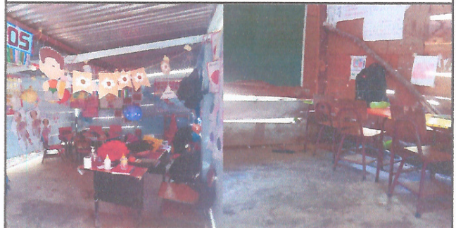
Foto 4: La comunidad educativa prioriza el mejoramiento con estrura portante metálica (tipo portico) y cubierta de techo con lámina troquelada Cal. 26

Observación: Si es necesario se pueden agregar hojas adicionales y actualizar el número de hojas.