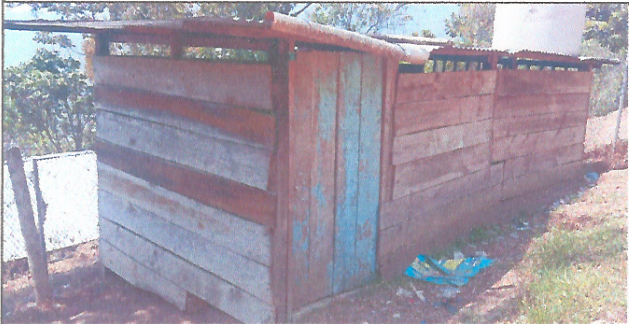
Foto 3: La comunidad educativa solicita la sustitución de área de cocina provisional con paredes y techo con lámina para asegurar el lugar para la preparación de la refacción escolar.