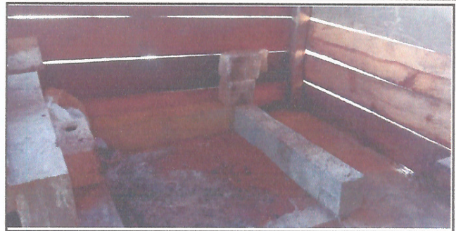
Foto 2: Se requiere mejorar el ambiente de la cocina para asegurar el lugar adecuado para la preparación de la refacción escolar